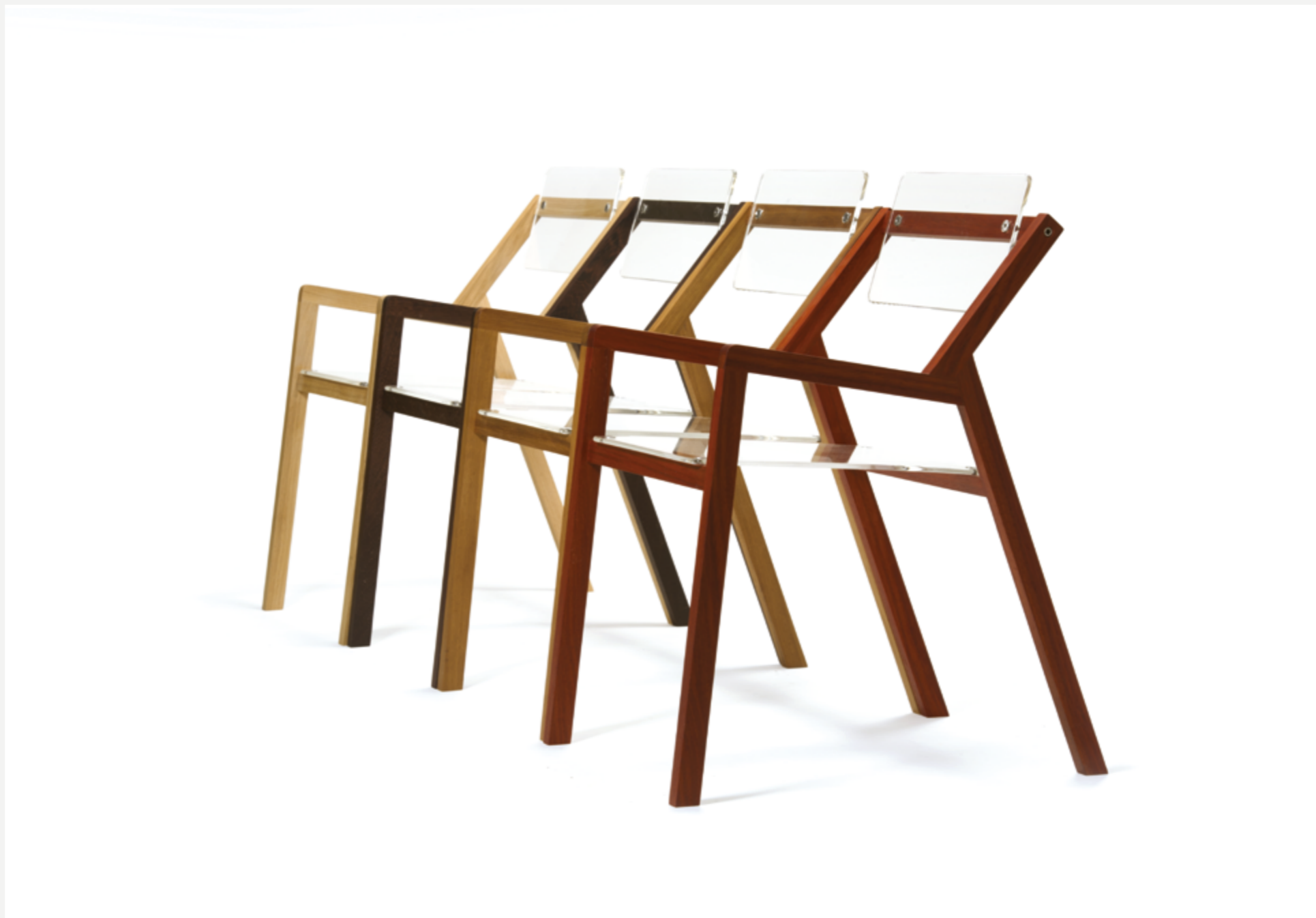
BLOCCO 55 sedia in rovere con seduta e schienale basculante in plexiglass sed_02 . maggio 2012