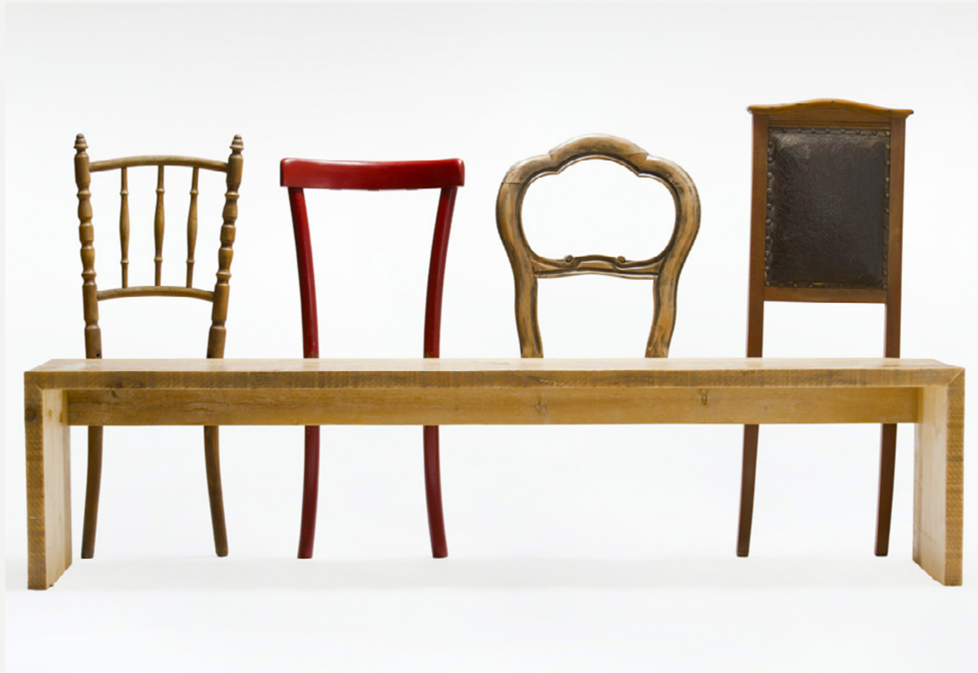
PANCA Panca in abete di recupero con schienali di vecchie sedie sed_01 . Settembre 2013