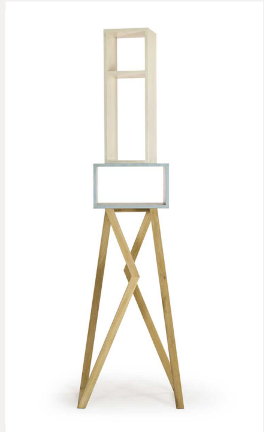
AVATAR moduli scultura in legno di acero e finitura in resina Anno 2016