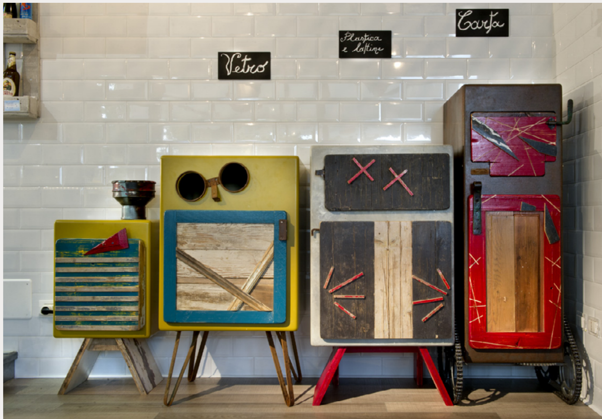
“PUPAZZI” PER RACCOLTA DIFFERENZIATA IN UN LOCALE