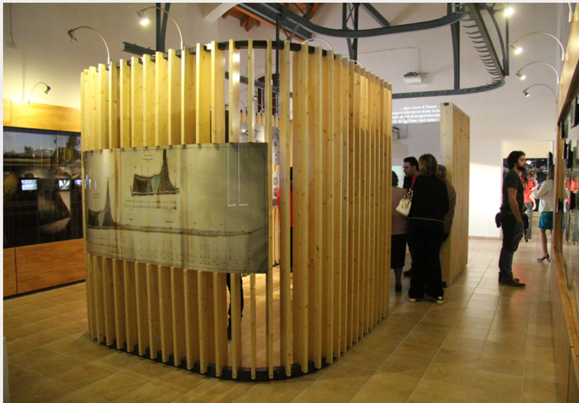
Museo dell'acqua di Avezzano Giugno 2012