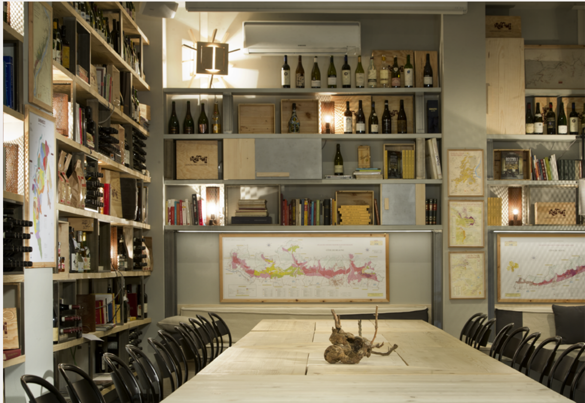
Rimessa Roscioli Giugno 2017