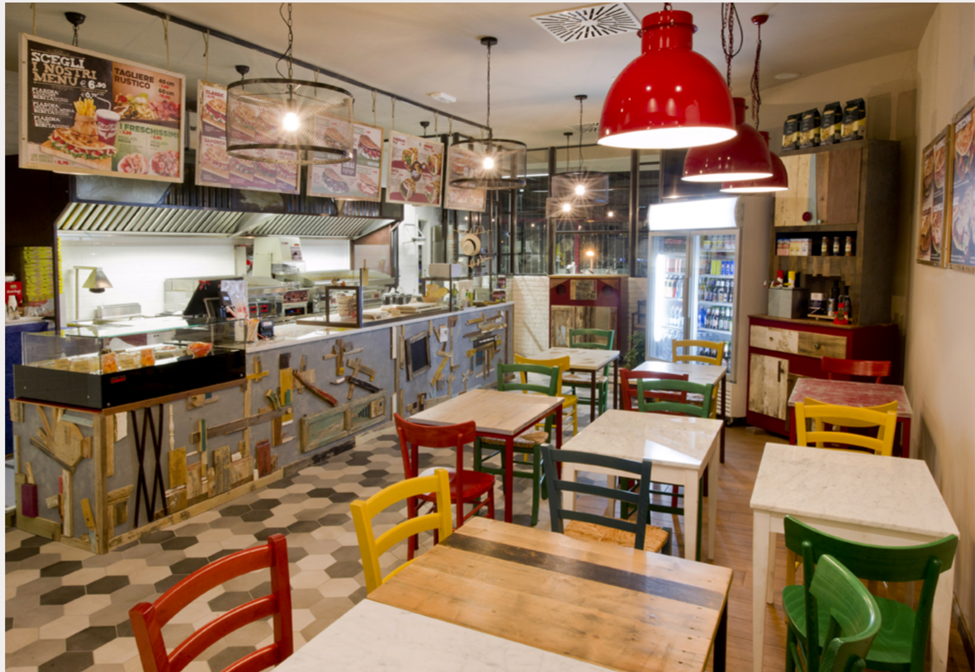
Bancone, tavoli e credenza per un locale