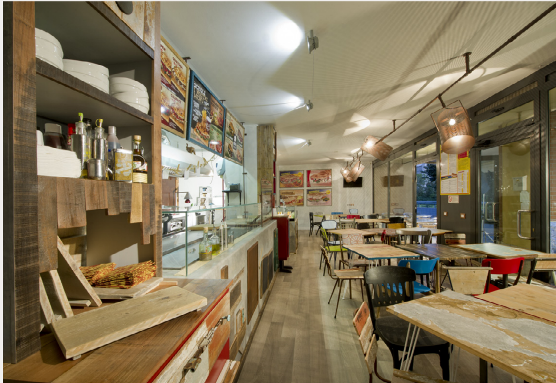
Un locale interamente arredato q21