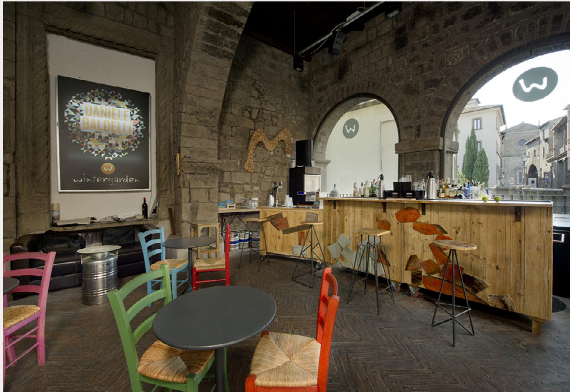
MAGNA-MAGNA VITERBO Settembre 2016