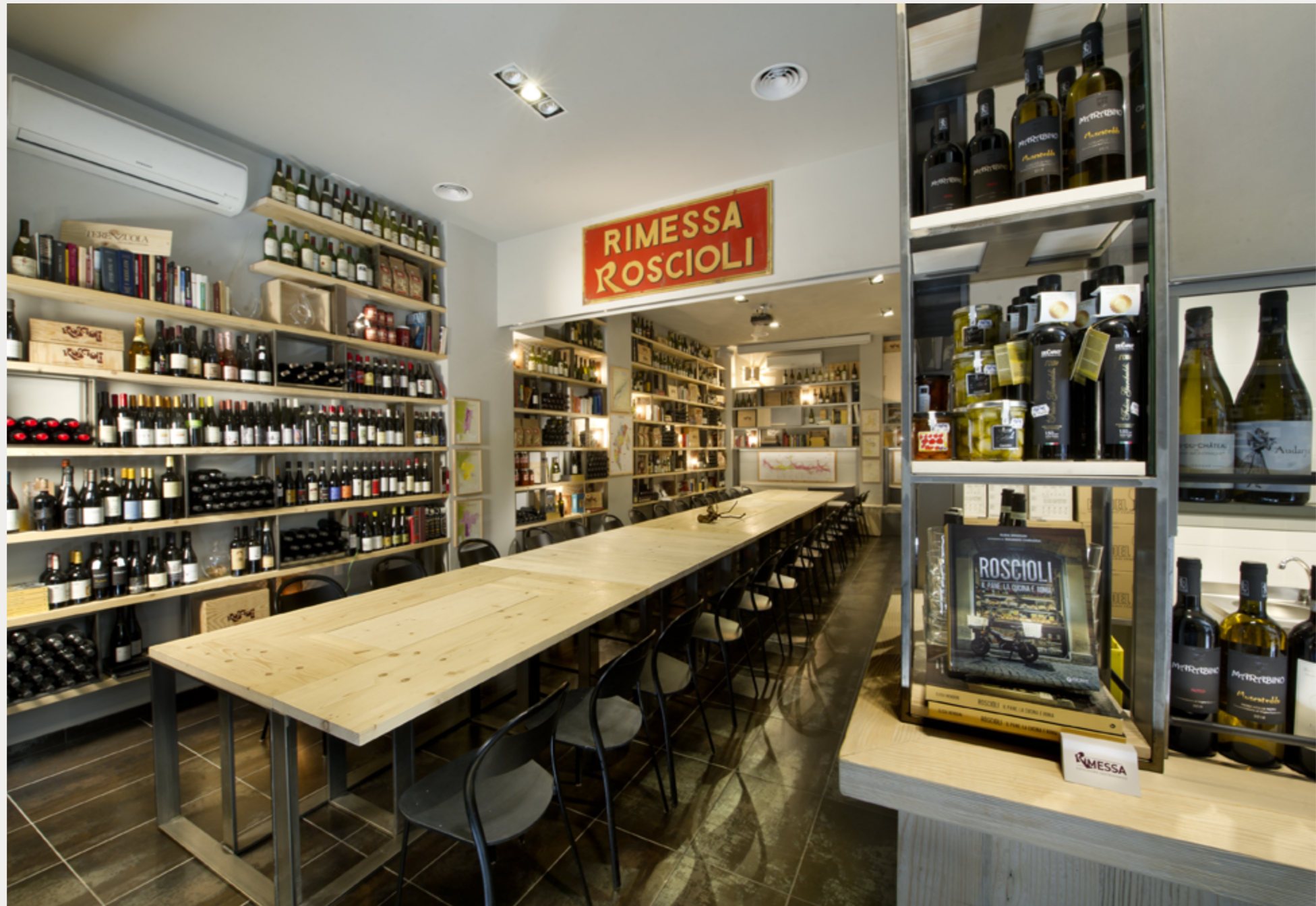
Rimessa Roscioli Giugno 2017