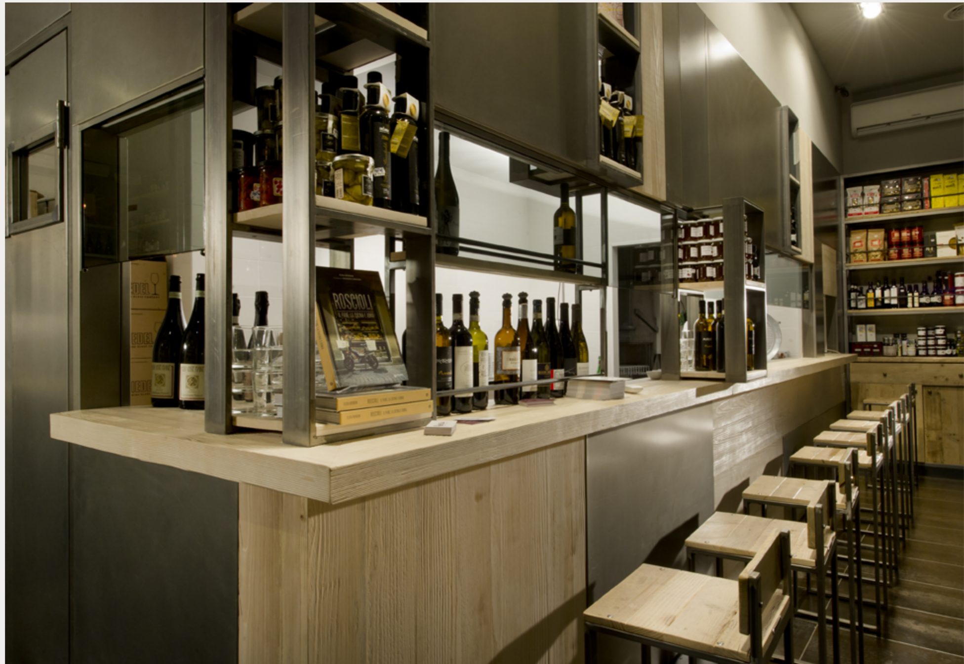
Rimessa Roscioli Giugno 2017