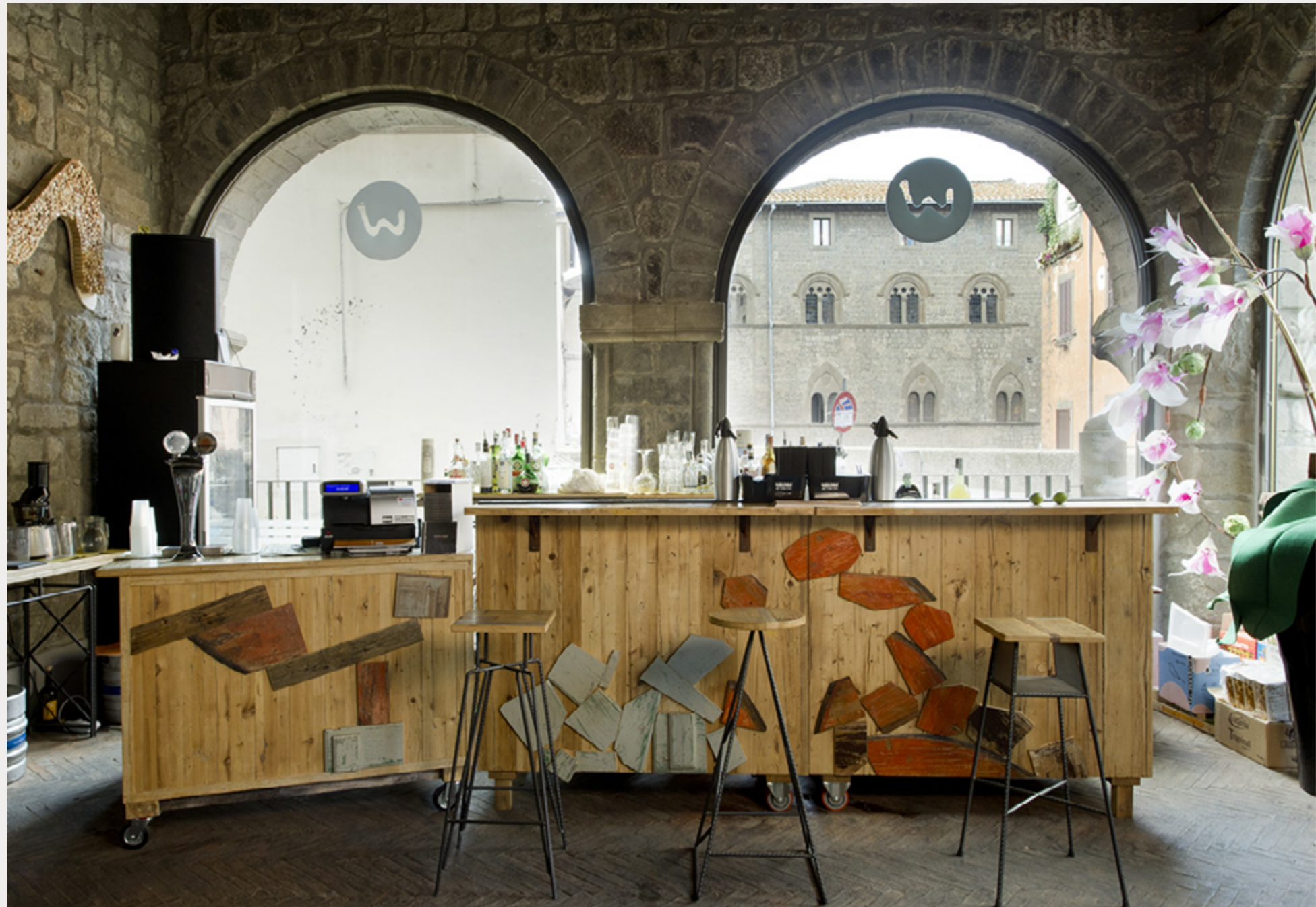
MAGNA-MAGNA VITERBO Settembre 2016