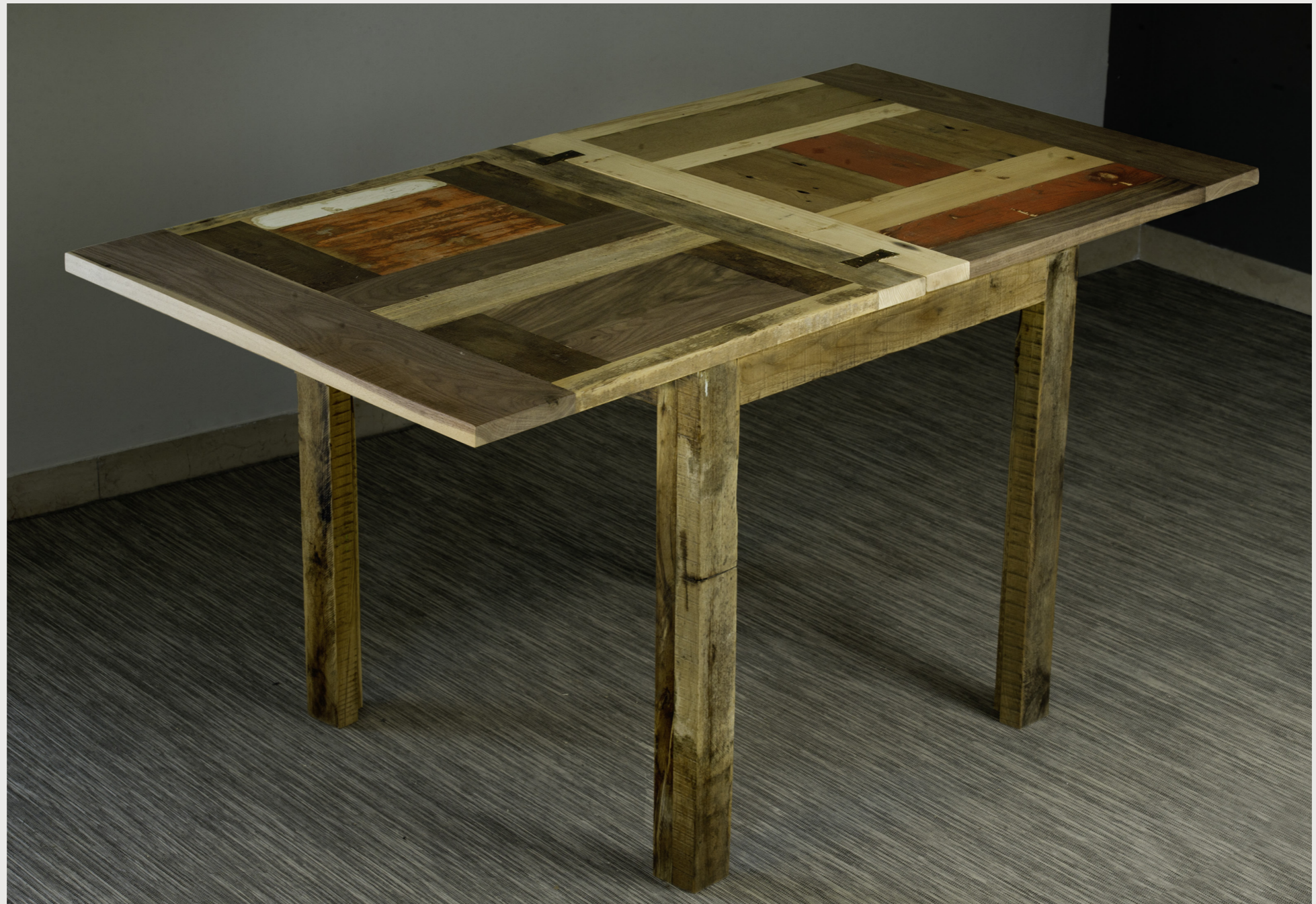
TAVOLO ARLECCHINO 2 Tavolo allungabile in legno di recupero e massello tav_29 . Settembre 2017