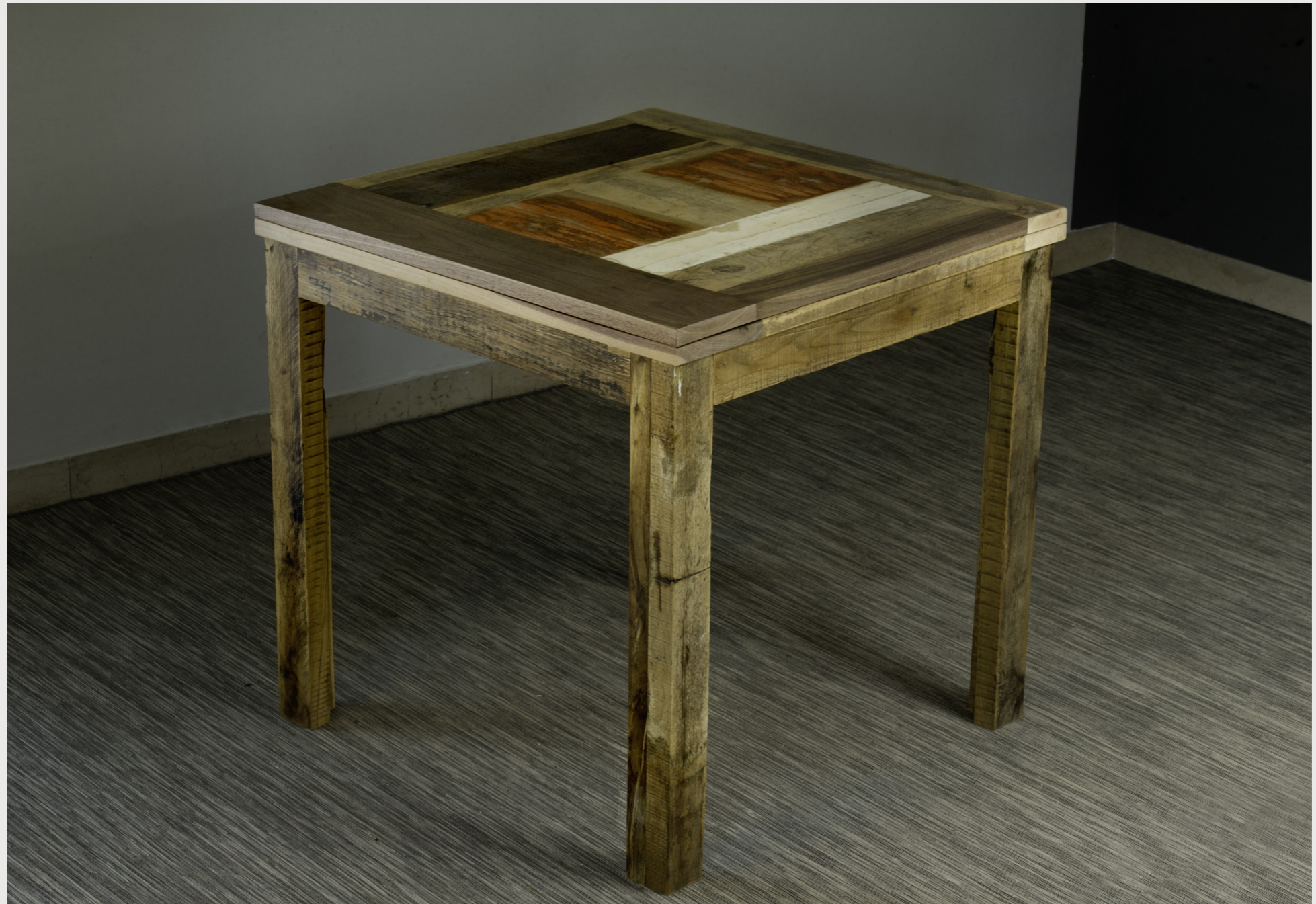
TAVOLO ARLECCHINO 2 Tavolo allungabile in legno di recupero e massello tav_29 . Settembre 2017