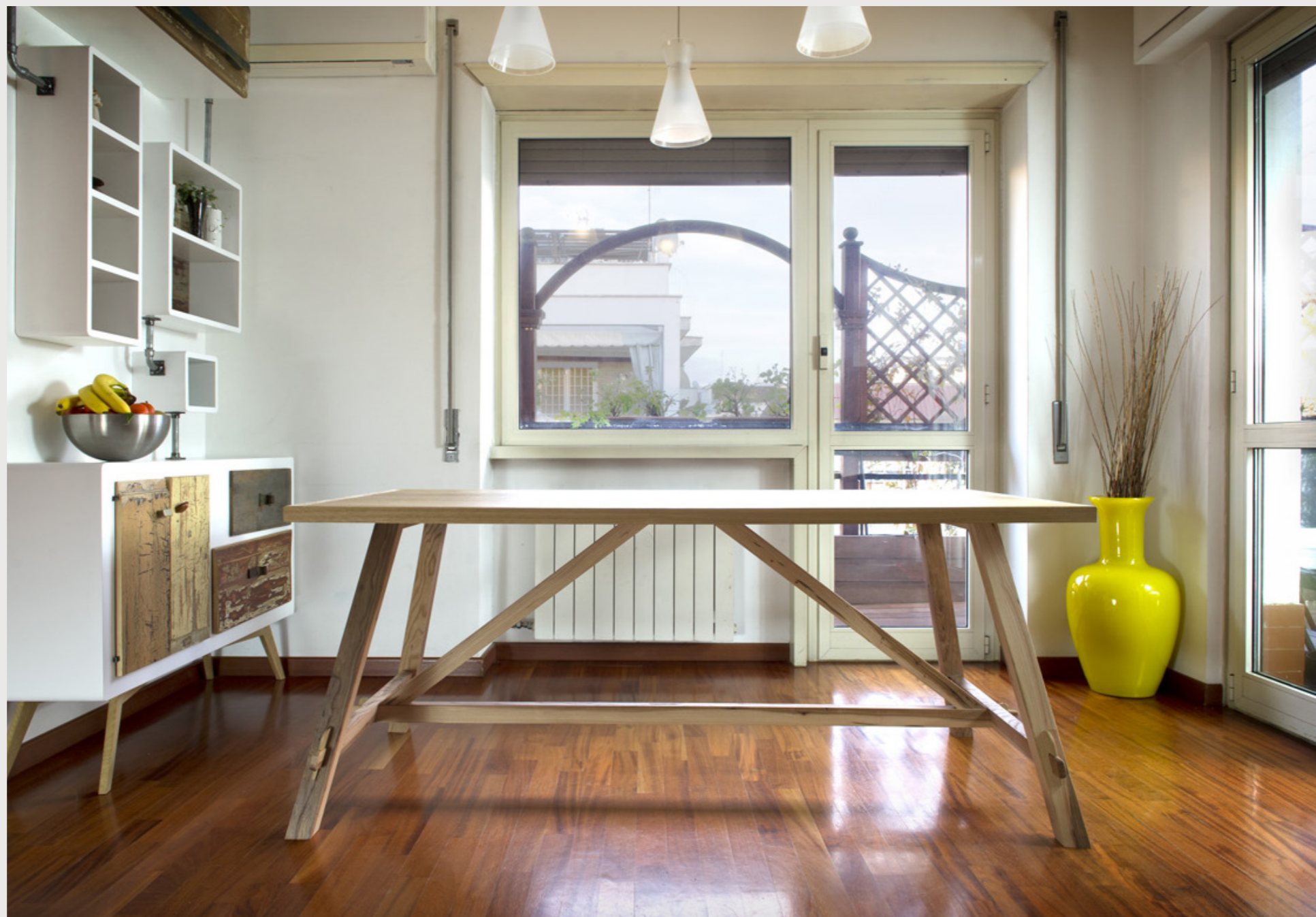
RENNY tavolo stile fratino con piano in rovere e base in olmo massello tav_03 . gennaio 2014