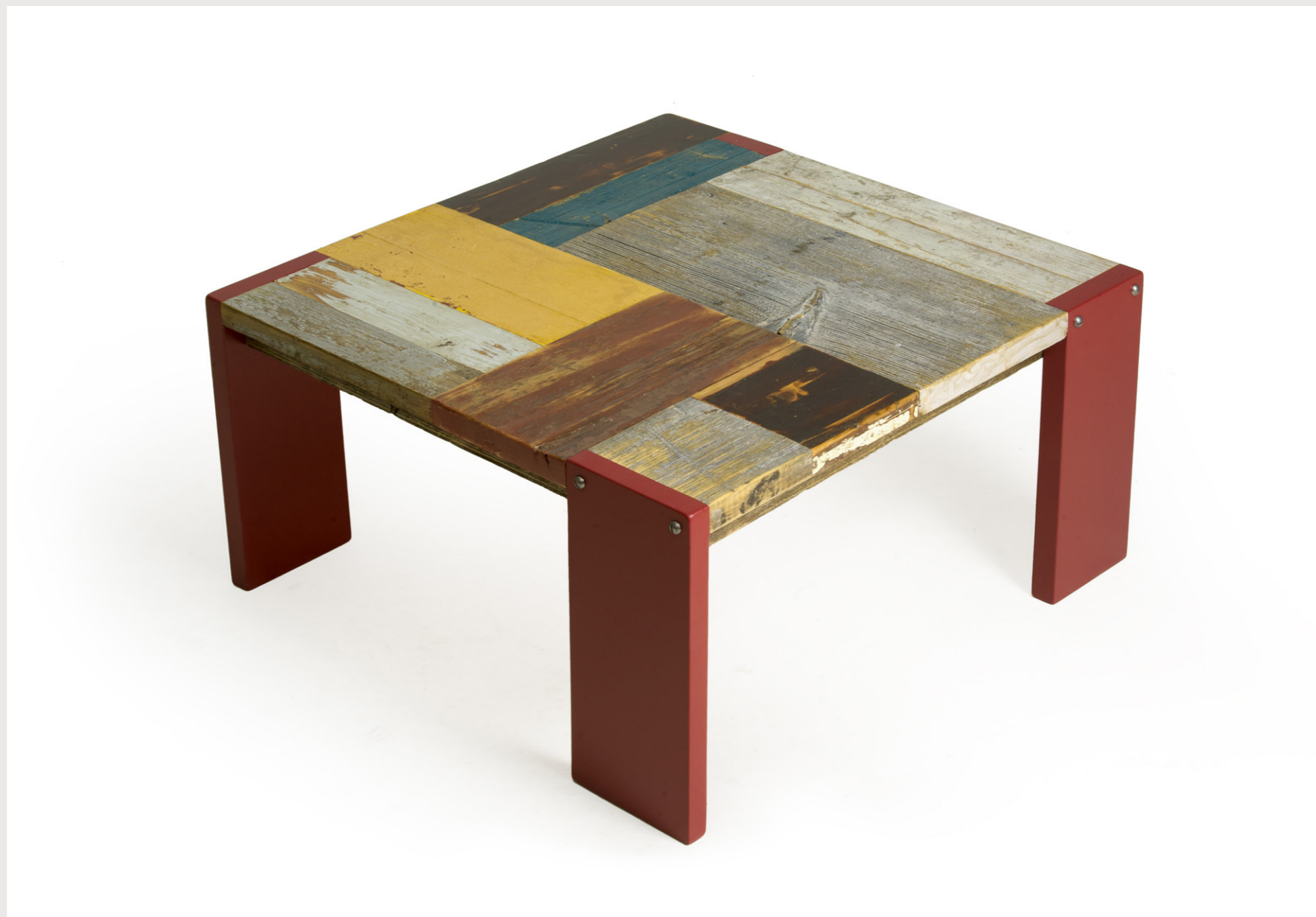
TAVOLO TETRIS tavolo basso con gambe a filo del piano. tav_25 . Settembre 2015