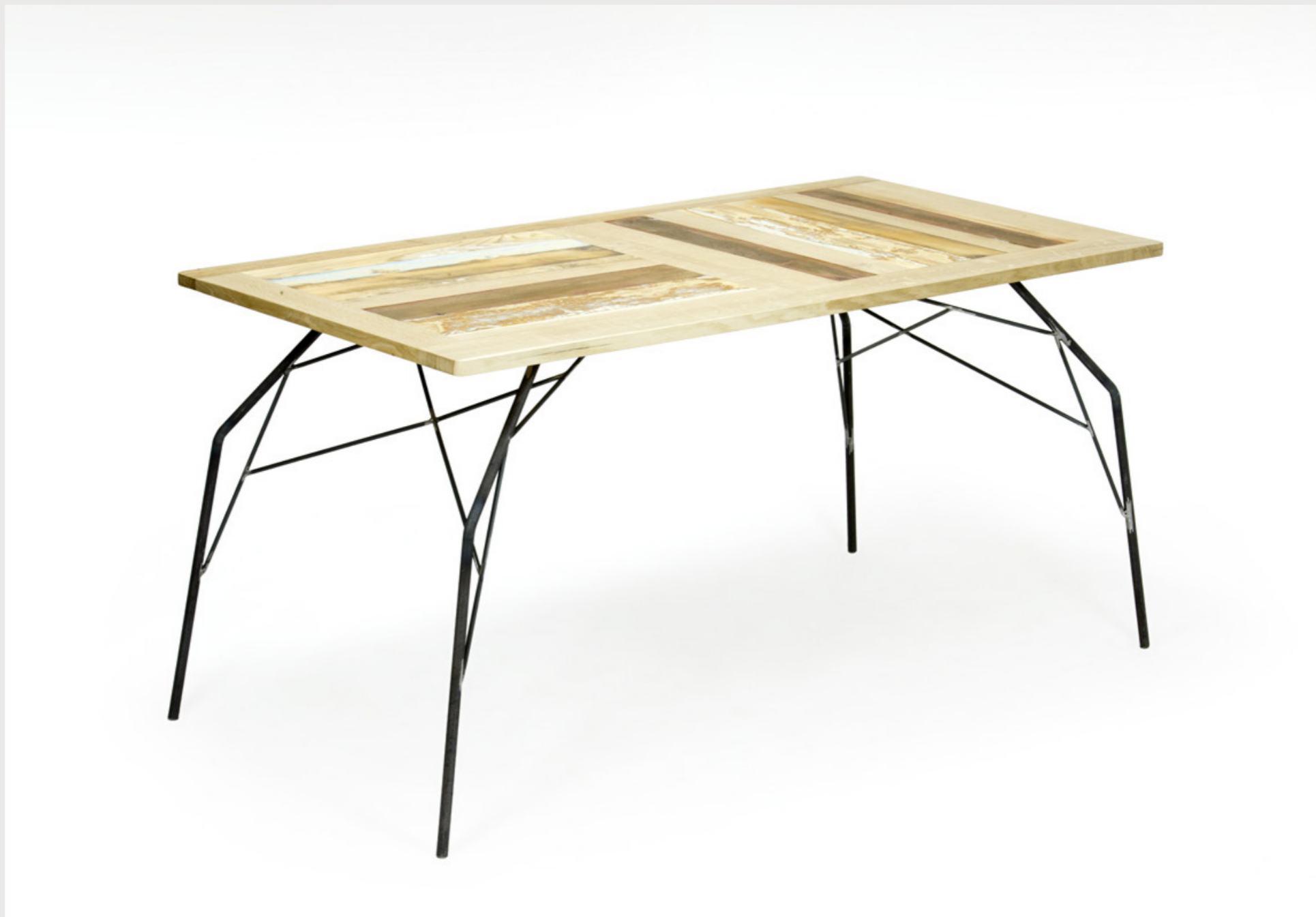
RAGNO tavolo con base in tondino di ferro e piano in rovere e legno di recupero tav_02 . Ottobre 2014