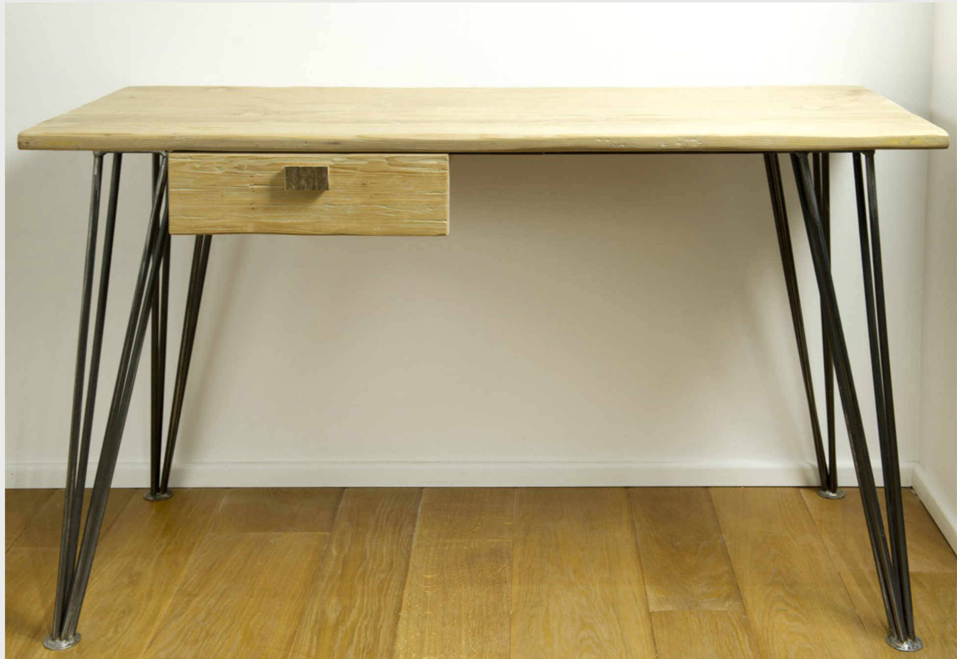
SCRIVANIA SPARTA scrivania con piano in legno di recupero e zampe realizzate con tondini di ferro tav_13 . gennaio 2013