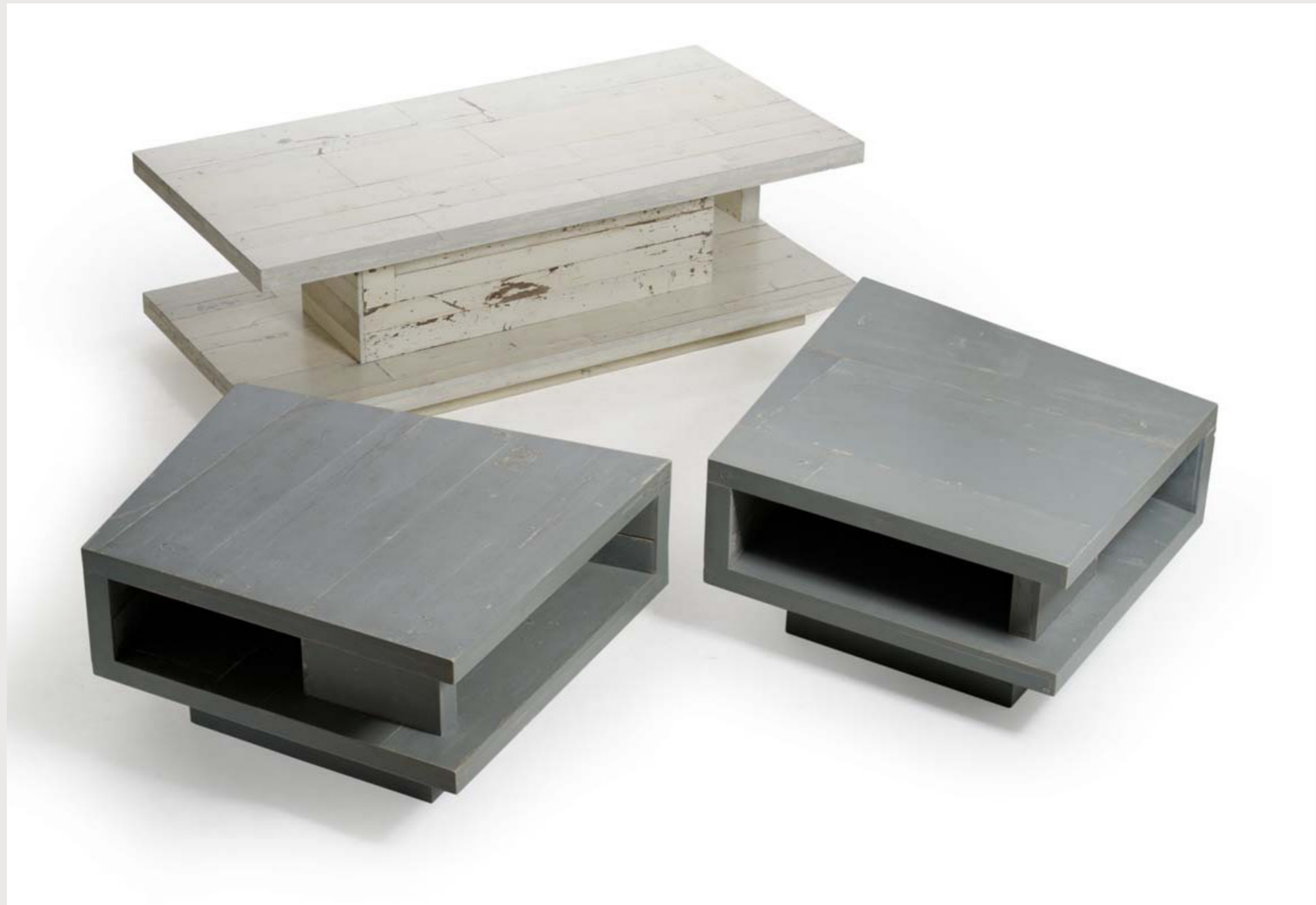
TRITTICO DI TAVOLI BASSI dettaglio