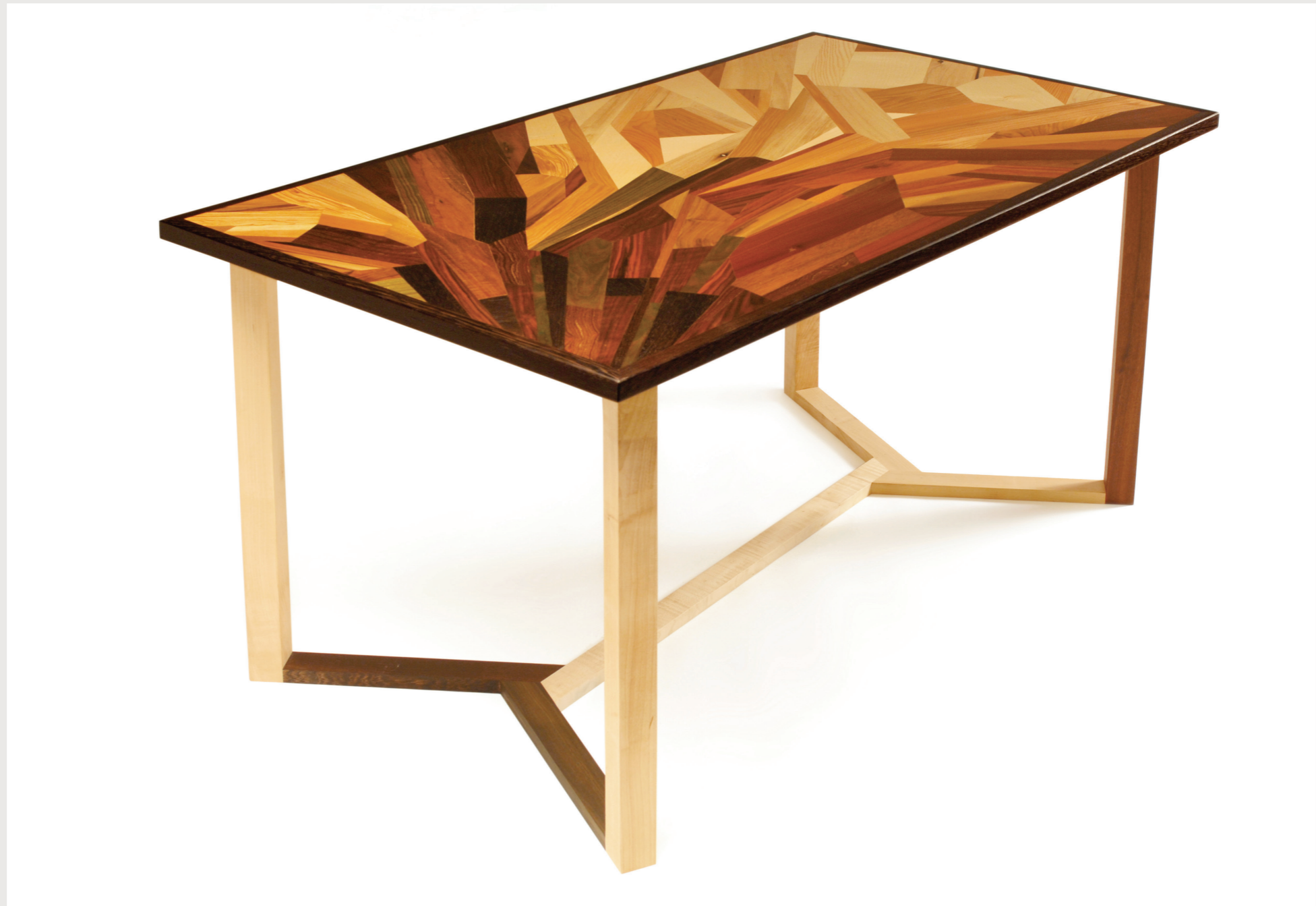
LUCEOMBRA tavolo con base in acero e wengè e piano realizzato con tarsia di diverse essenze lignee tav_19 . gennaio 2012